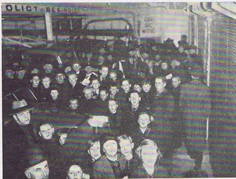
Besøgende i Garagehallen

Mægtig Publikumstilstrømning til den nye Mønsterstation.