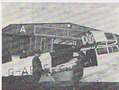
Baaren tages ud af Flyvemaskinen