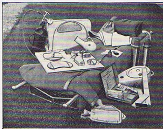
Ambulanc-flyvemaskinens specielle Udstyr.

derigennem være med til at lindre mange Smerter og redde Menneskeliv.