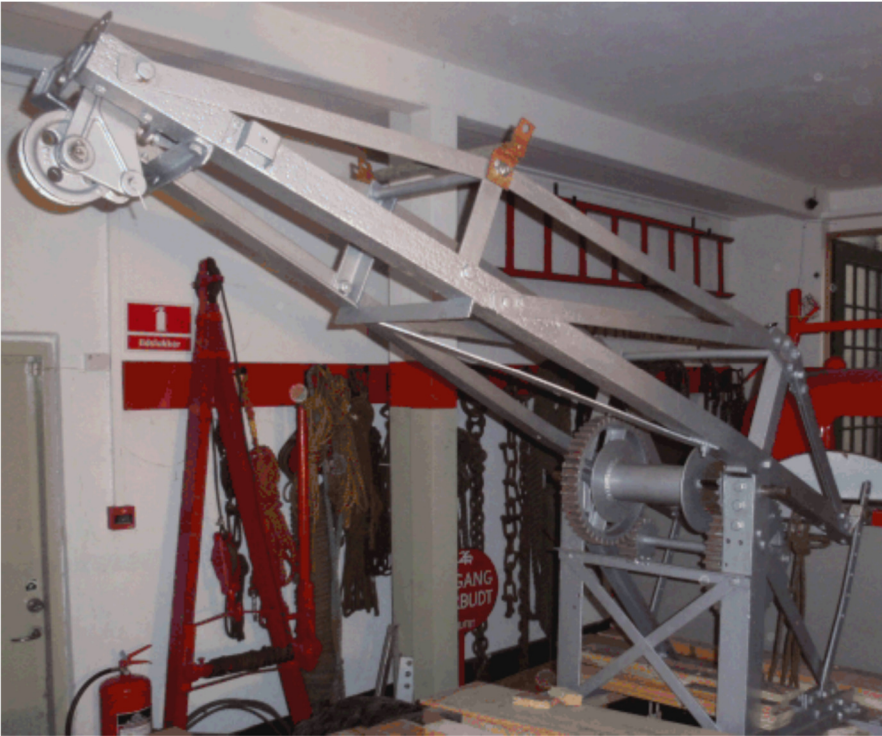
18. november 2015. Kranen sat på