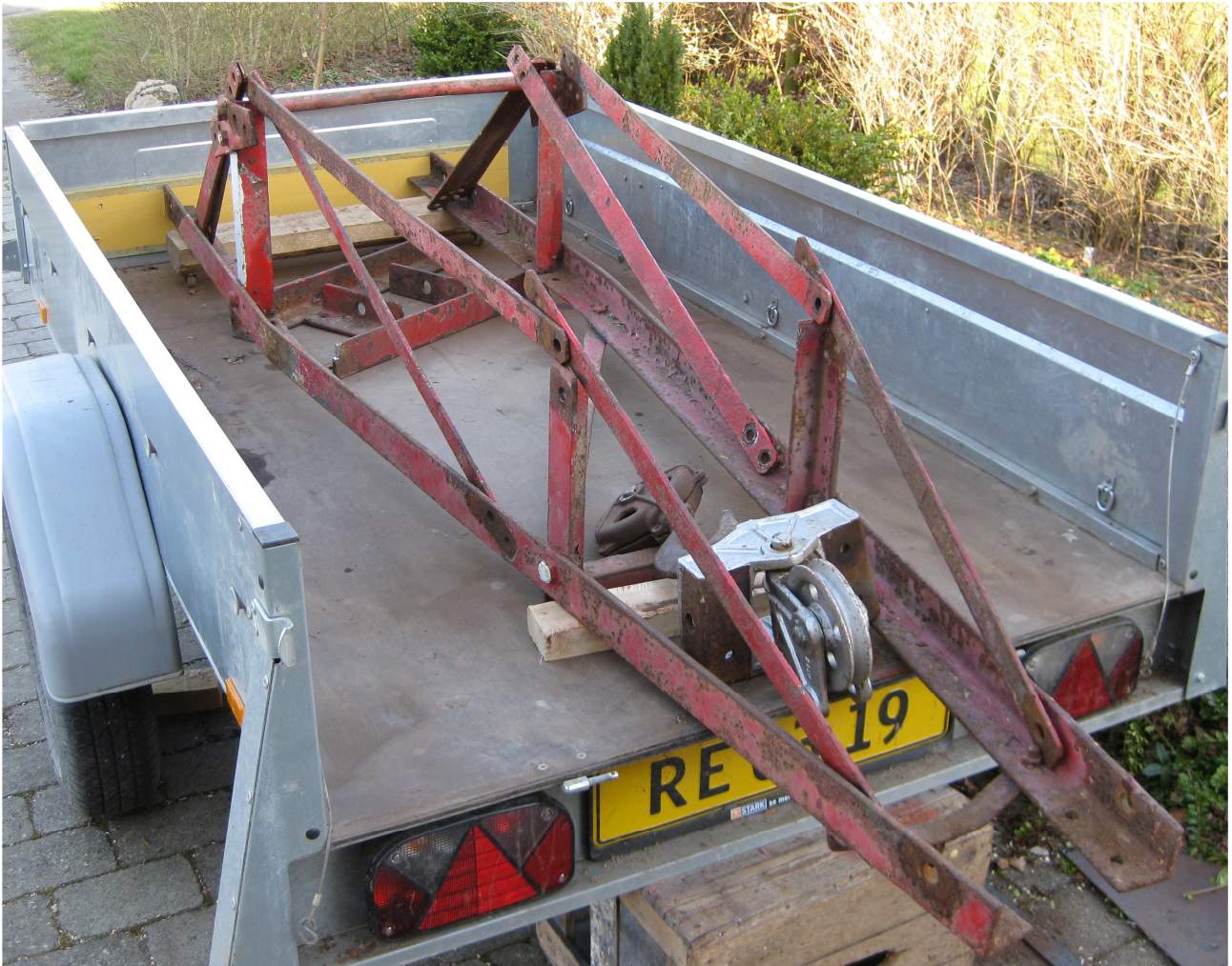
18. marts 2014. Alle delene er nu klar til sandblæsning