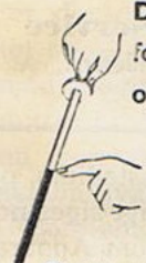
Oliepinden viser det ringe Forbrug

Massefabrikation af: Ætsede Skilte og Reklameartikler